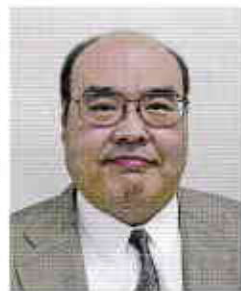
一般社団法人山口県柔道協会 会長