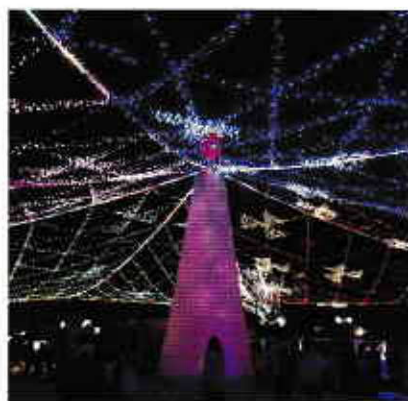
周南冬のツリーまつり