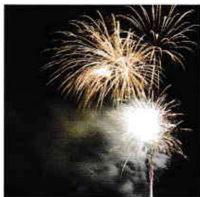
かの冬花火「銀嶺の舞」