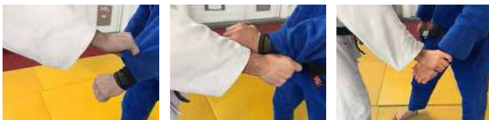
ポケットグリップ、ピストルグリップ、手首をロックする（握る）

・袖部分のピストルグリップやポケットグリップは直ちに攻撃をしない場合、指導が与えられる。