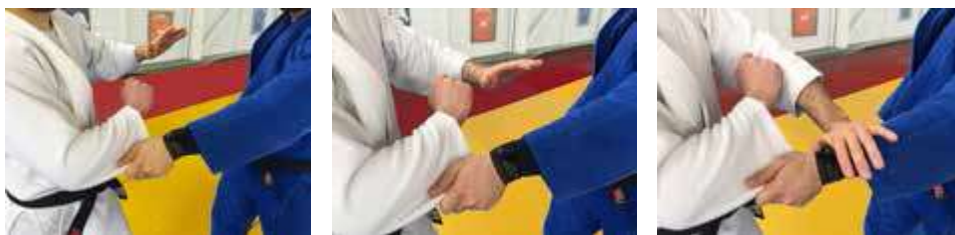
相手の腕や手を叩いて組手を切る